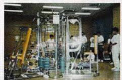
旧トレーニング室