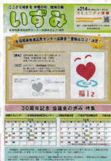
▲いずみ 214号 愛称とロゴ製作