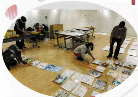
▲永福和泉こどもの絵 美術館(2P)展示準備