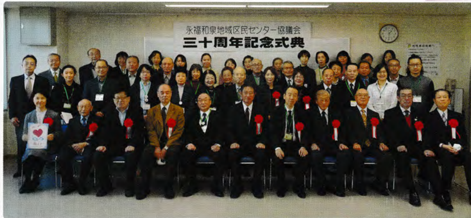
永福和泉地域区民センター協議会 三十周年記念式典