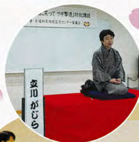
◀防犯落語 二つ目立川がじら