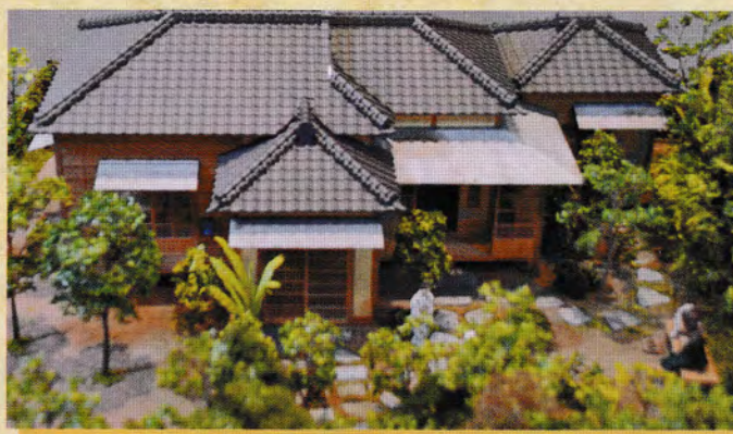
井伏鱒二旧宅復元模型

関東大震災後の昭和2年(1927年)、荻窪に居を構えた井伏鱒二は、以後60余年をこの地で過ごし、近隣に住む文士と交流しながら、数多くの作品を世に遺しました。準常設展「杉並文学館」では「荻窪風土記」の原稿やその他の作品群、ゆかりの品等、井伏鱒二の足跡を辿るとともに、井伏と交流のあった青柳瑞穂・上林暁・外村繁・太宰治ら「阿佐ヶ谷会」の文士たちの業績も紹介します。そのほか杉並にゆかりのある作家たちの作品も展示。杉並の文学の広がりを感じてください。