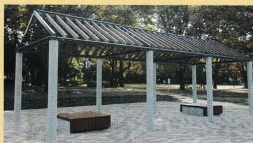
パーゴラ(上流 善福寺川緑地に設置)

善福寺川にかかる白山前橋(はらっぱ広場脇)から武蔵野橋(済美公園脇)まで12の橋にまたがる和田堀公園。杉並区内で豊かな緑地帯である公園全域が、震災時皆さんの命を守る防災公園に指定されています。