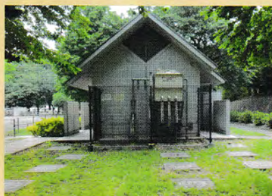
多機能トイレとマンホールトイレ

その中でも大型ヘリコプター臨時離発着場・支援部隊などの活動可能な大規模救出救助活動拠点候補地になっています。