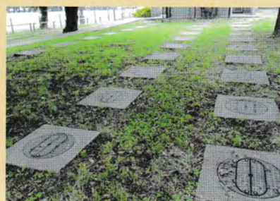
マンホールトイレ