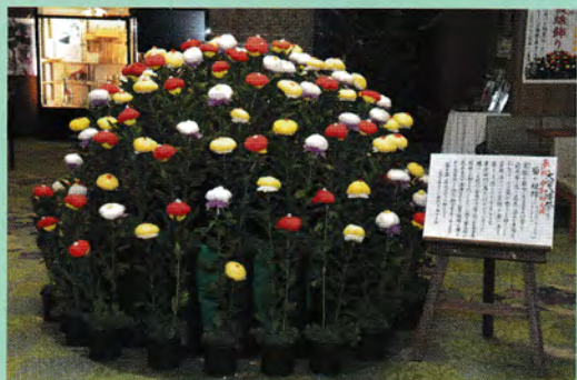
重陽の節句「菊被綿」

杉並大宮菊花展は、大宮八幡宮の外郭団体である杉並大宮菊の会が主催で開催しております。杉並区内外在住の菊の愛好家の会員が丹精込めて作った菊の大輪が、大宮八幡宮の境内を彩ります。この時期七五三詣のご家族で賑わい、菊の前で記念写真を撮る光景が見られます。