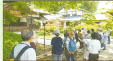
⇨ 大圓寺境内 ⇨ 元気に移動中