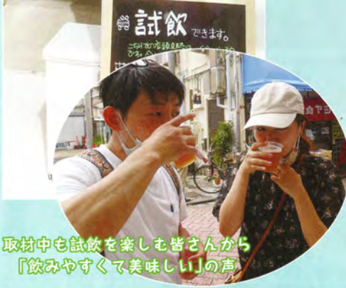
取材中も試飲を楽しむ皆さんから「飲みやすく美味しい」の声