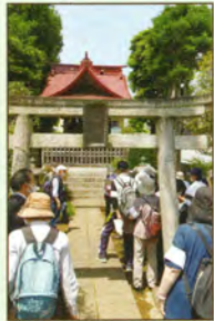
⇐ 貴船神社 ⇨ 龍光寺境内