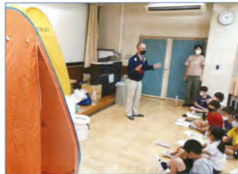
△防災授業 小・中学校等の要請により、防災に関する授業を実施します。