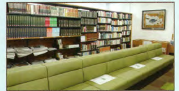
▲ソファでゆっくり読書

旧永福図書館の蔵書約10万冊はすべて現在の図書館に移し、多くの蔵書が目にとまるように配置しています。シニアに人気の大活字本、利用度の高い地図・ガイドは貸出カウンター近くに、家事・教育本はガラス張りのこどもの本コーナーに隣接させ、椅子も増やしてこども連れやシニアの方が本を選びやすくなっています。