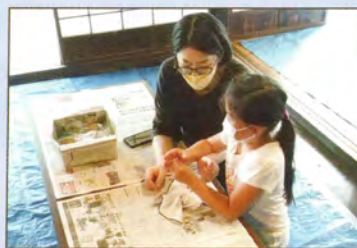
ビー玉を止めてみるね

約30分後、叩き終わったら葉を剥がし、少し乾かしてから石鹸で洗えば、布に染みこんだ緑が空気に触れてきれいな薄い藍色に変化してゆく光景に、参加の皆さんも満足そうでした。