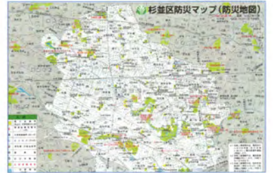
△防災マップ・ハザードマップの作成 発災時の避難所となる『震災救援所』等を地図で示しています。