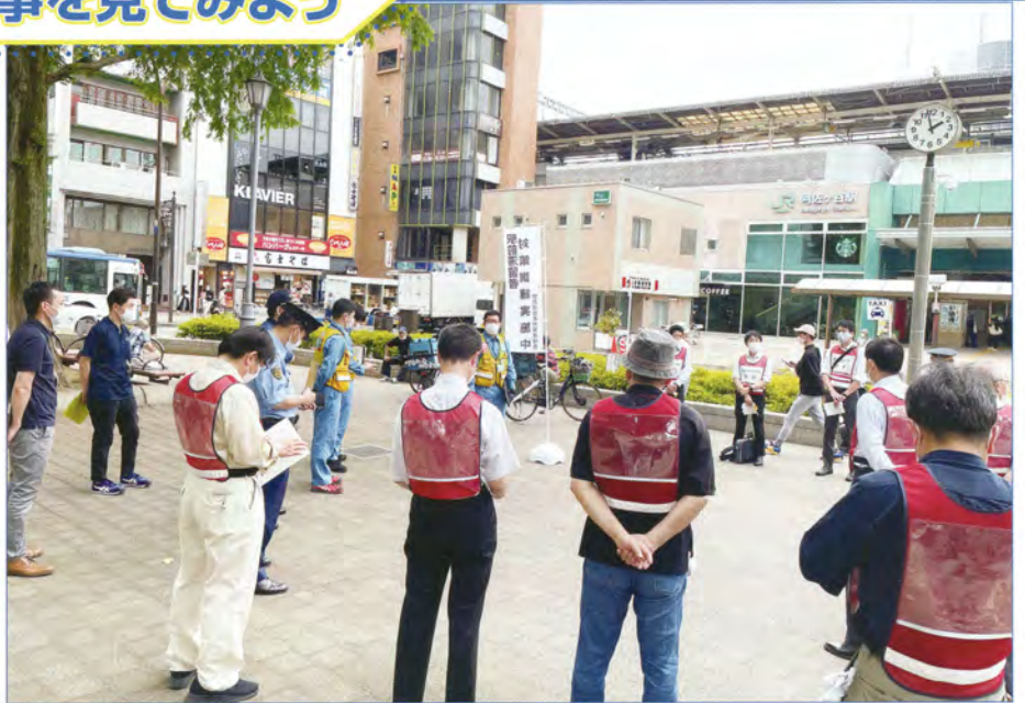
△阿佐ヶ谷駅前滞留者訓練 発災時、帰宅が困難となった駅前滞留者の対策訓練を実施しています。