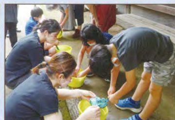
どんな仕上がりがかな？