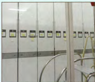
▲ガラス越しの閉架書庫

地域の憩いの場となっている3Fにはヤングアダルト(中高生)向け本棚を設置、1Fでの貸出・返却窓口、21時までの開館は通勤通学の方にも便利です。また、視覚障害者・身体障害者の方にはご希望の図書・雑誌などの対面朗読サービス(申込みは事前予約制で中央図書館に電話してください)もあります。