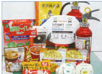
△防火用品のあっせん 消火器や非常食、家具転倒防止器具などを定価より安く購入することができます。