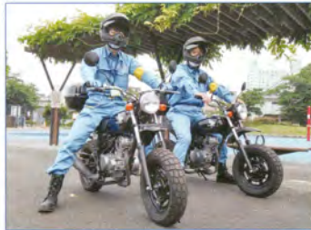
△防災課バイク隊 水害時、川の氾濫状況等を現地確認します。