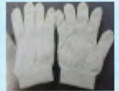
▲暗闇で光る手話手袋