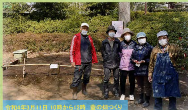
令和4年3月11日 10時から12時 藍の畑づくり

当協議会文化講座「永福和泉・大宮の史跡めぐり」(申込締切5月5日)のガイドも担当されます。