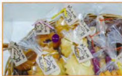
マドレーヌ(プレーン)は1コ80円▶