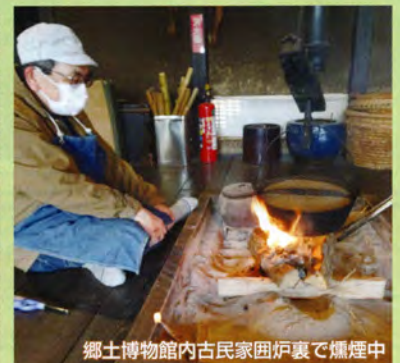
郷土博物館内古民家囲炉裏で燗燗中