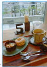
ベーグルとミニアヒージョ▶