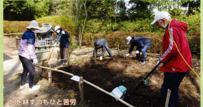
畑を耕すのもひと苦勞